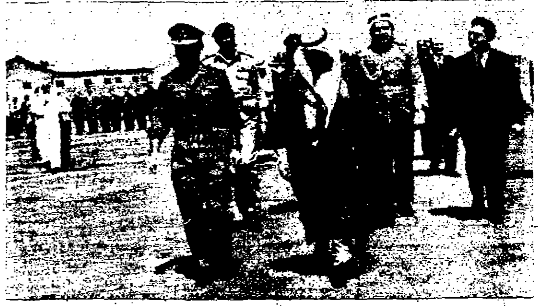
الملك لدى وصوله الى الكويت الشقيق في استقباله سمو امير دولة الكويت . وفي الصورة سمو البحر حسن والرئيس التتويهي

مدينة حاكم البحرين وقد اتم عقبة حاكم البحرين مساء امس ملية عشاء تكريماً لجلالة الملك المعظم حضرها سمو البحر حسن ولي العهد المعظم والسيد بهجت التتويهي رئيس الوزراء وبقية اعضاء الوفد والاقارب لجلالته ، وكبار المسؤولين في البحرين . وكان جلالة الملك المعظم قد وصل